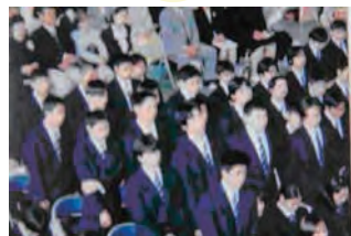
現在の紺ブレザー